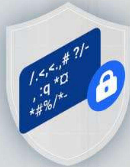
Crittografia AES a 128 bit

Abbiamo progettato la telecamera H3 2K in modo da rispettare i vostri spazi privati e garantire la sicurezza di ogni byte di dati. Sull'app EZVIZ è possibile configurare le aree riservate 5 che non devono essere filmate: in questo modo, siete sicuri di registrare solo quello che volete. Inoltre, le registrazioni sono completamente crittografate, così da restare private e sicure.