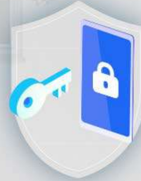
Autenticazione a più fattori