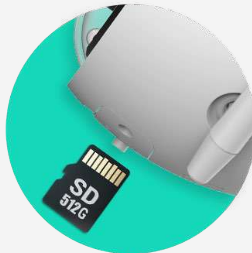
Supporta schede micro SD 1

Puoi tenere al sicuro i video registrati su una scheda micro SD locale di 256 GB, oppure abbonarti a EZVIZ CloudPlay, il servizio di archiviazione su Cloud illimitato e completamente crittografato.